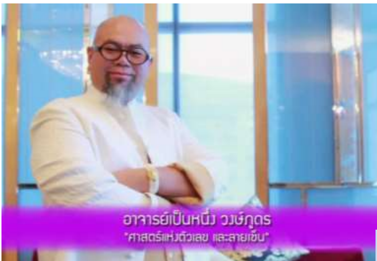
อาจารย์เป็นหนึ่ง วงษ์ภูธร "ศาสตราจารย์พิเศษ และสายชั้น"

ค่ำ รับประทานอาหารค่ำ ณ ห้องอาหารของเรือสำราญ COSTA FORTUNA