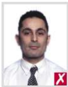
ใกล้เกินไป