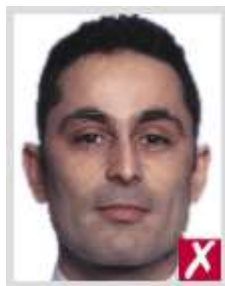
ใกล้เกินไป